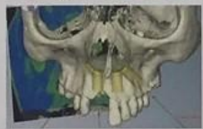
（左上）ウィーン大学名誉教授のラブラチェック先生の理論に基づいて開発された新時代のシステムである顎機能咬合解析システム （左）コンピューターガイドシステムなどの先端機器をフル活用