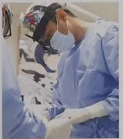
難症例をはじめとする高度インプラント治療を行う

歯肉が足りなければ歯肉を増やし、骨が足りなければ骨を移植するなどの方法を行った上で、インプラント治療に臨みます。