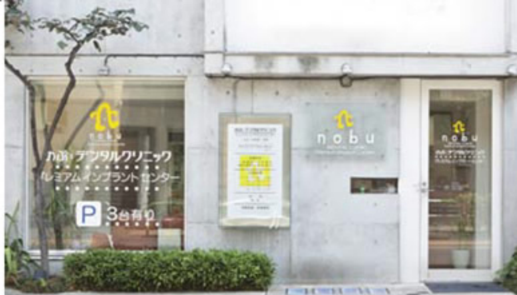
のぶ:デンタルクリニック本院

こはらざわ・ともぶ ● 東京医科歯科大学総合診療科を経て、2002年に医療法人社団歯整会ののぶ:デンタルクリニック開院。04年、のぶ:デンタルクリニック三宿開院