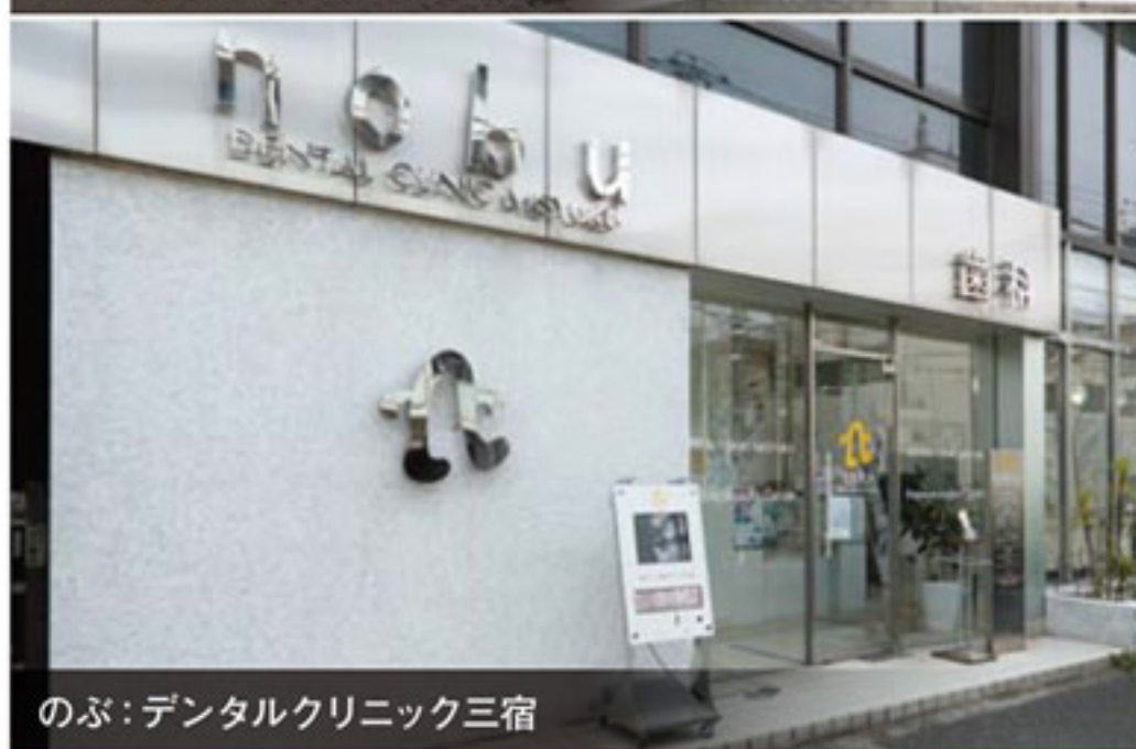
のぶ:デンタルクリニック三宿