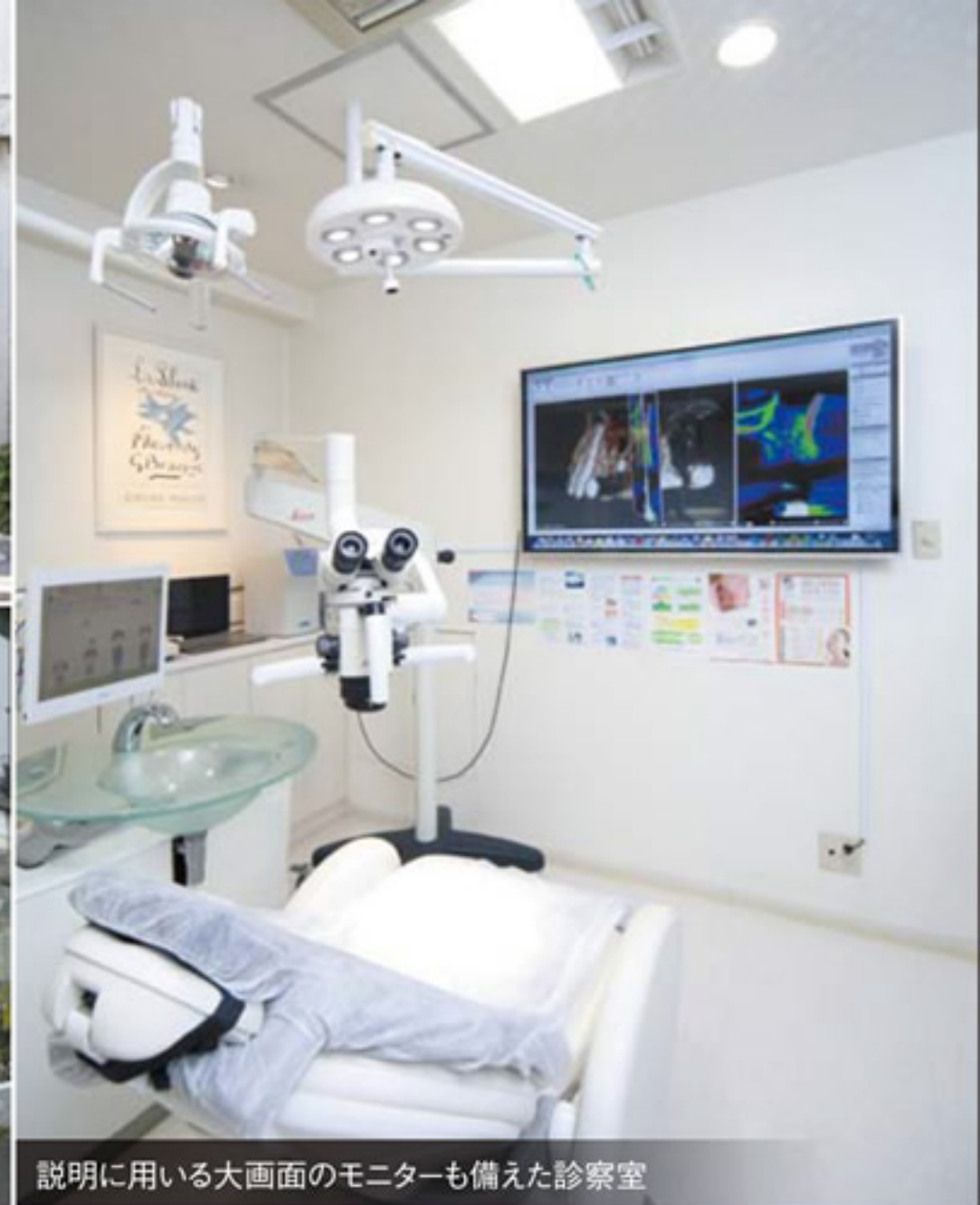
説明に用いる大画面のモニターも備えた診察室