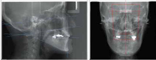
専用のソフトウェアで適切な あごの形のシミュレーションを行う